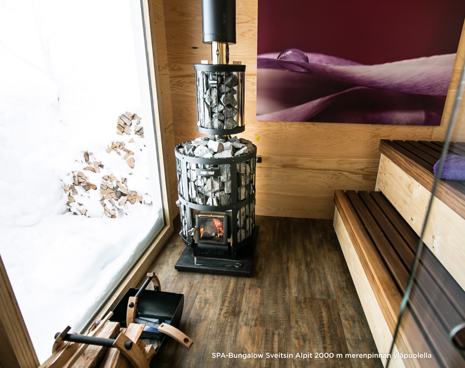
SPA-Bungalow Sveitsin Alpit 2000 m merenpinnan yläpuolella