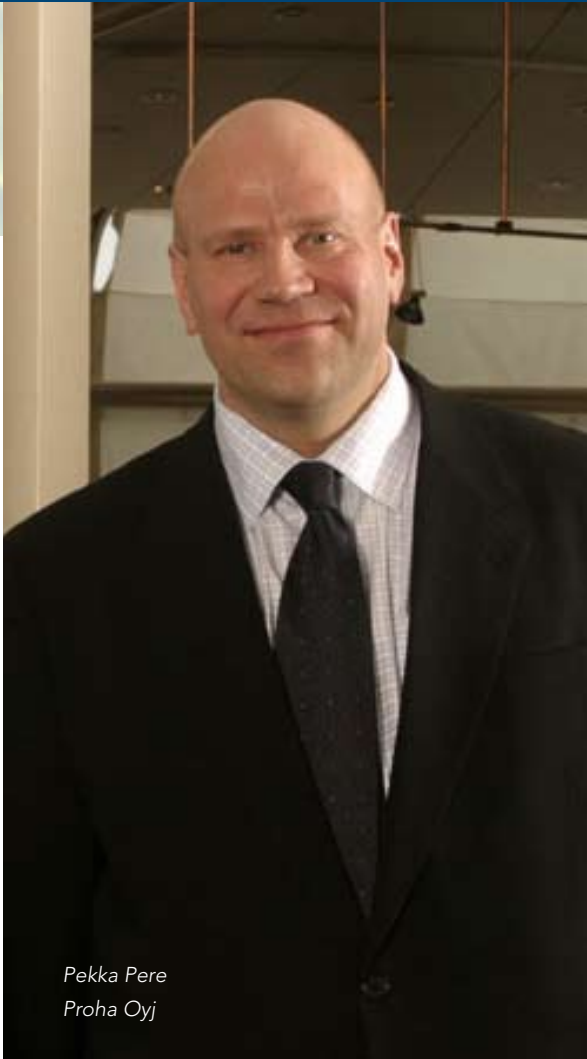
Pekka Pere Proha Oyj

alueella on kuitenkin hyvä. Yhteistyösuhteet kansainvälisillä markkinoilla painottuvat nyt uudella tavalla, ja voimme Artemiksen työläänsaneerauksen asemesta keskittyä uudella tempolla kehittämään ja myymään niitä tuotteita, joiden uskomme olevan uudenlaisen projektijohtamisen perustana.