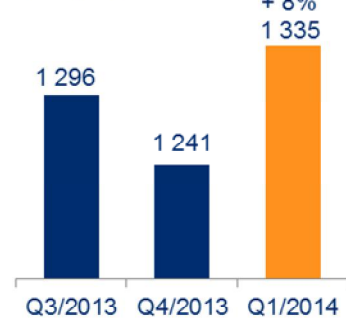
Tilaukanta (milj. e)