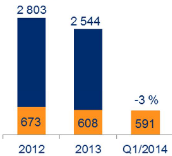
Liikevaihto (milj. e)