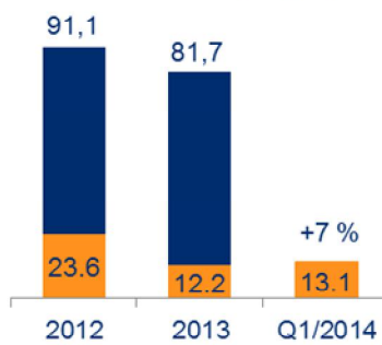
Käyttökate ilman kerta- luonteisia eriä (milj. e)