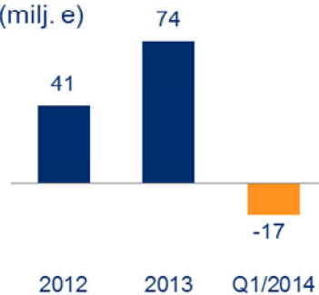
Kassavirta investointien jälkeen (milj. e)