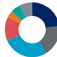
Henkilöstö maittain maaliskuun 2014 lopussa

■ Ruotsi 23 % ■ Suomi 27 % ■ Itävalta 4 % ■ Muut maat 8 % ■ Norja 19 % ■ Saksa 14 % ■ Tanska 6 %