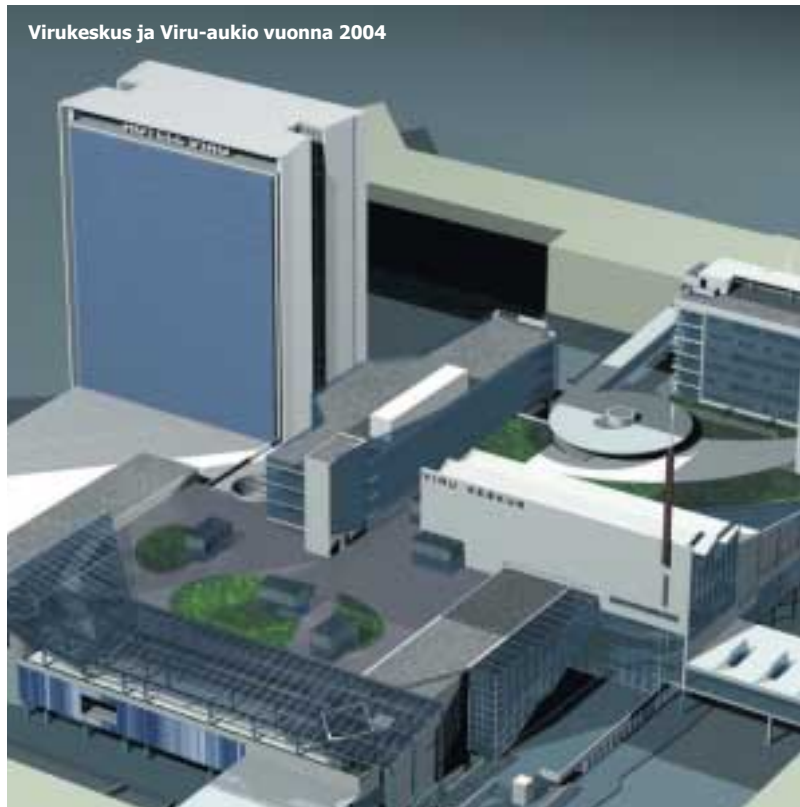
Virukeskus ja Viru-aukio vuonna 2004