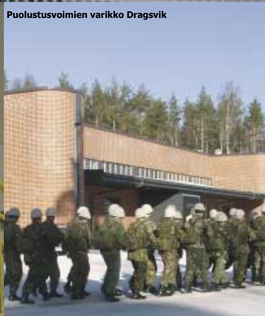
Puolustusvoimien varikko Dragsvik