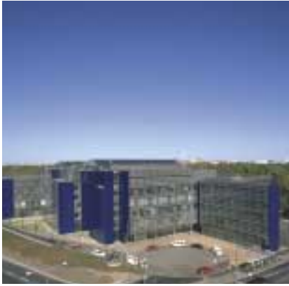
Ilmarisen toimitalo, Ruoholahti