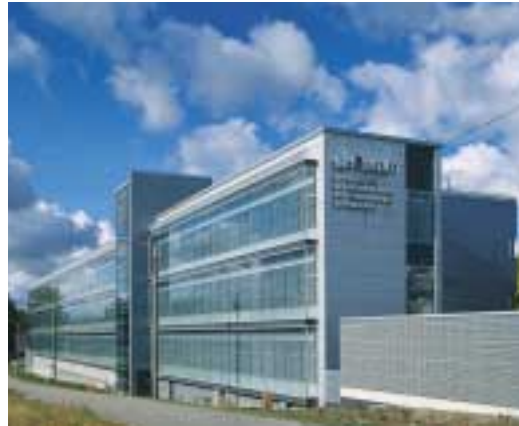
SRV Yhtiöiden uusi toimitalo Espoon Niittykumpussa

kiinteistökehittäjinä Baltiassa ja Venäjällä. Tilikaudella valmistui Latviassa kolme kauppakeskusta, kaksi toimistotaloa ja asuinrakennus Riikaan ja Liettuassa Englannin suurlähettilään residenssi Vilnaan. Rakenteilla olevista kohteista merkittävimmät ovat Virossa Tallinnan keskustassa Virukeskuksen ja Viru-aukion rakennustyöt.