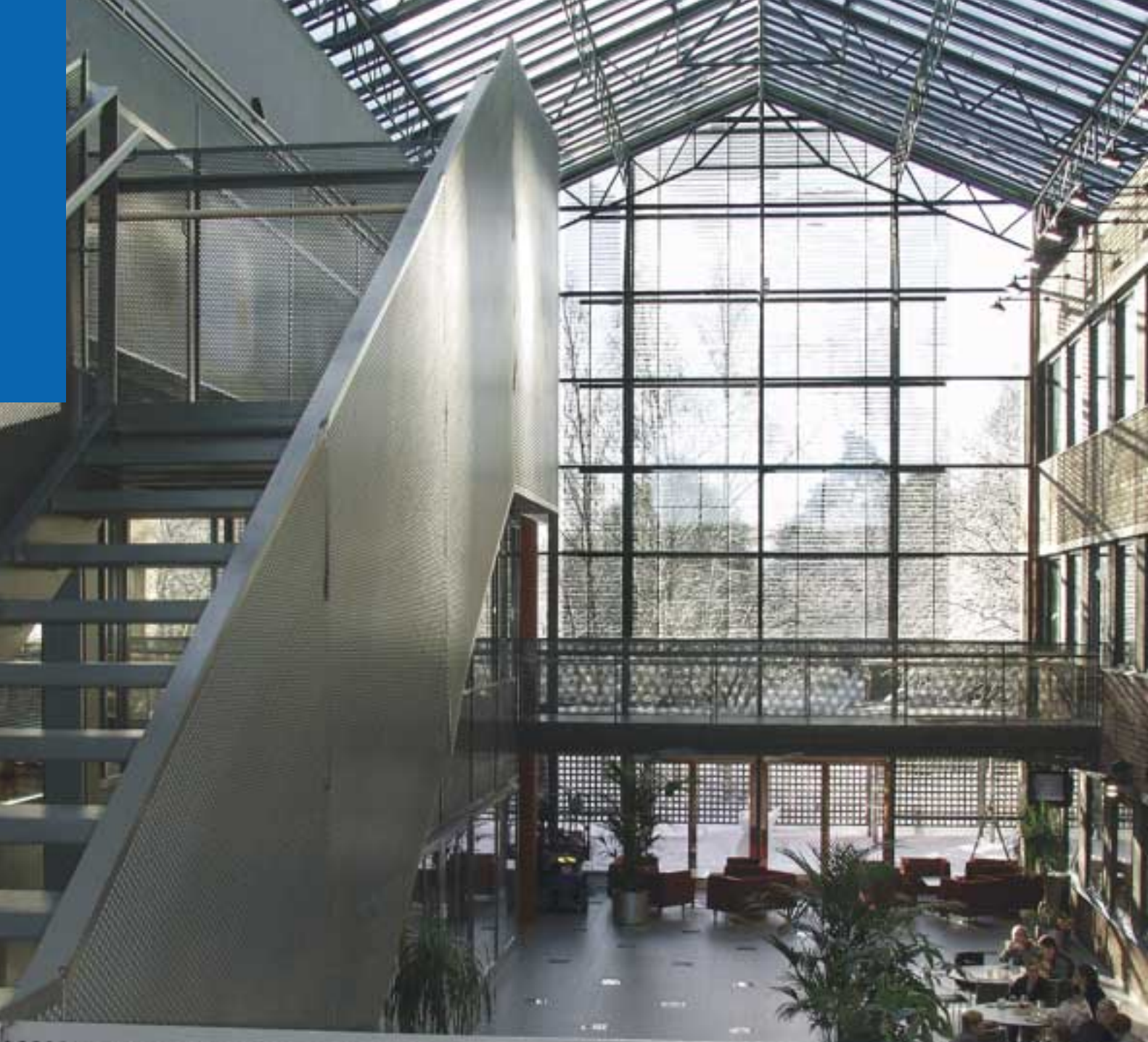
Haaga Instituutti ja Ammattikorkeakoulu