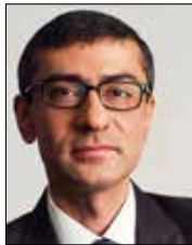
PUHEENJOHTAJA RAJEEV SURI, S. 1967 Nokia Oyj:n toimitusjohtaja. Johtokunnan jäsen vuodesta 2014. Nokian palveluksessa vuodesta 1995.

Bachelor of Engineering, Electronics and Telecommunications, Manipal Institute of Technology, Mangalore University, Karnataka, India.