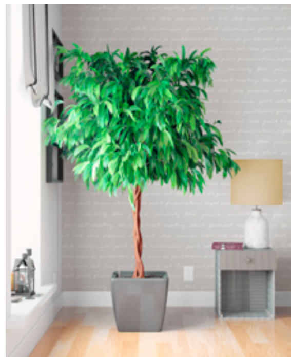
Sandudd Roller 9 -malliston Teksti-tapetti