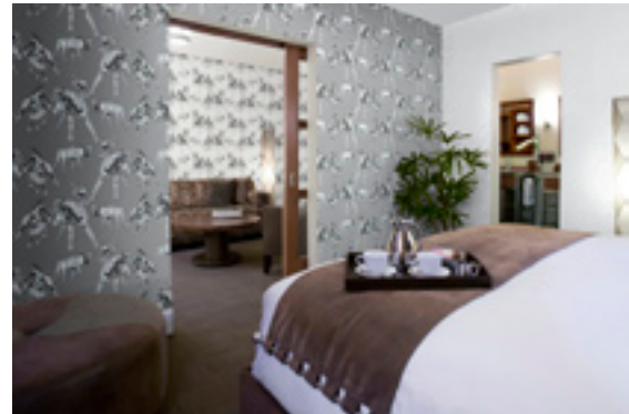
Sandudd Roller 9 -malliston Hirvi-kuviointi

Itse valmistettujen Sandudd- ja Design Otto -tapettien lisäksi Sandudd on merkittävä tapettien maahantuoja. Tapettituot- teidemme päämarkkina-alueena on Pohjoismaiden lisäksi Itä-Eurooppa. Sandudd-tapetteja ja FinnTurf -ruohomattoja viedään yhteensä yli 50 maahan ympäri maailmaa.