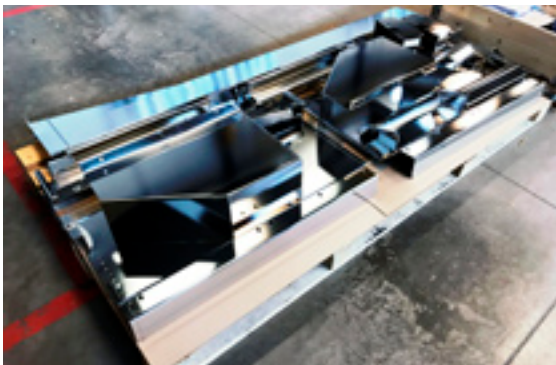
Eesti Elecsterin työn tulosta. Sähköisesti kiillotetut kompo- nentit näyttävät erittäin laadukkaita.

Eesti Elecster onkin onnistunut tuotannon tehostamisessa uu- distamalla organisaatiotaan ja parantamalla tehokkuuttaan.