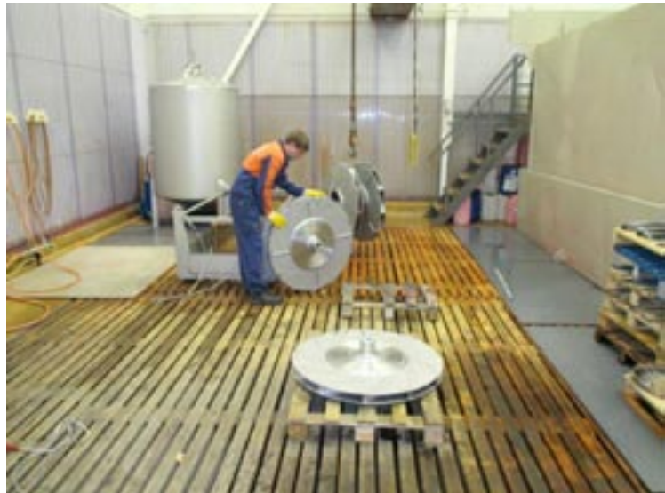
Eesti Elecster valmistaa koneiden osia alihankintana emoyhtiön lisäksi myös muihin pohjoismaisiin yrityksiin.

Vuoden 2014 aikana jatkettiin määrätietoista tuotannon tehokkuuden ja laadun kehittämisohjelmaa uusimalla 40-vuotishlavuottaan viettävän Reisjärven tehtaan Flexopainolaitteet kokonaisuudessaan. Investoinnin myötä painokapasiteetti kaksinkertaistui ja painolaatu nousi huipputasolle. Tunnuksena erinomaisesta painolaadusta belgialainen yhtiö Esko myönsi meille Full HD Flexo -kumppanuussertifikaatin.