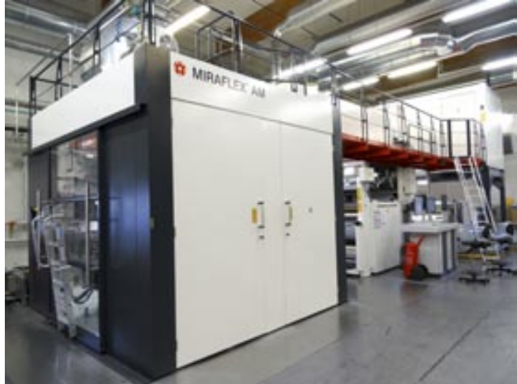
Reisjärven muovitehtaan asiakkaiden pakkauksien painatuslaatu nousi maailmanlaajuiselle huipputasolle uusien painokoneiden myötä.

Näin asennusaika itse projektikohteessa lyhenee lähes puoleen kilpailijoihin verrattuna. Jälkimerkkinointiin kuuluvat myös takuuajan jälkeinen ennakoiva huolto ja luotettava tekninen tuki. Tämä onkin yksi asiakkaiden eniten arvostamista tekijöistä Elecsterin toiminnassa.