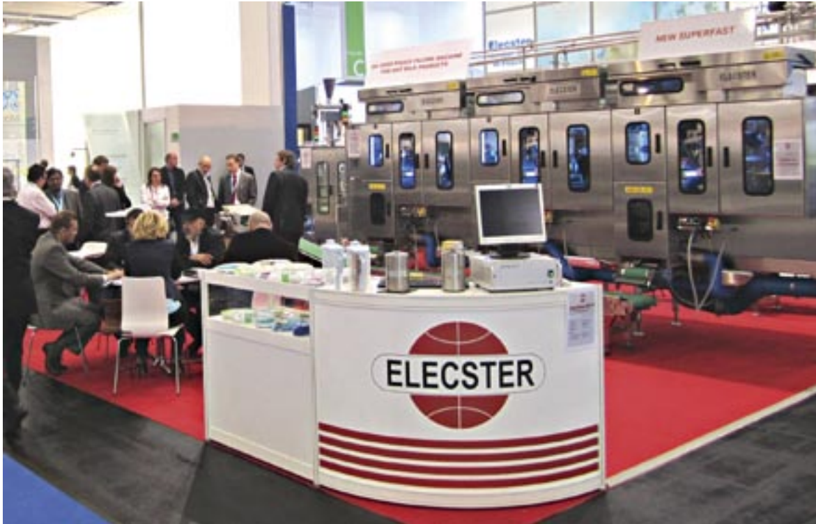
Elecster osallistuu tänäkin vuonna alan tärkeimmille messuille, jotka pidetään kolmen vuoden välein Saksassa. Kuva on viime kerralta Anuga Foodtech 2012- messuilta.