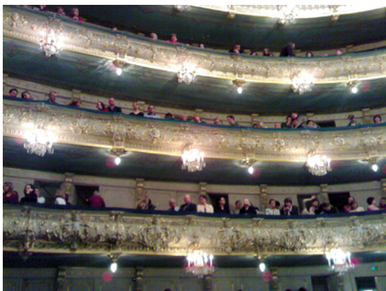
Kulttuuri-ilta, Teatteri Mariinski