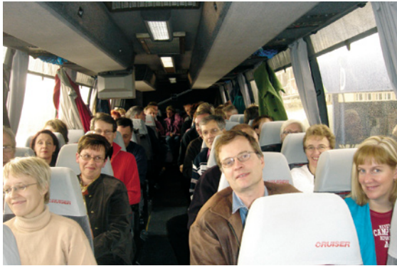
Linja-autossa on tunnelmaa...

Juhlavuoden kohokohdaksi muodostui henkilökunnan puolisoineen tekemä yhdistetty tutustumis-/ juhlamatka Pietariin. Venäjä on ollut tärkeä kauppakumppanimme aivan alkuvuosista lähtien, siksi vierailu Pietarin toimistollamme ja tutustuminen Pietarin tarjoamiin monipuolisiin kulttuuripalveluihin oli luonnollinen valinta.