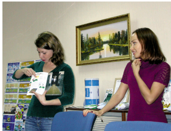
Vierailu Pietarin toimistossamme